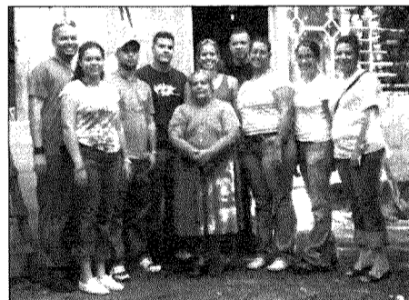
Grupo 1, Ayuda Comunitaria

Luego de esta actividad cultural la CEIA tenía como meta realizar varias ayudas comunitarias en la isla nena. El grupo se dividió en dos, unos establecieron puntos de control y los observaron con GPS por dos horas para densificar la cantidad de controles en Vieques y el otro grupo colaboraron con ciudadanos