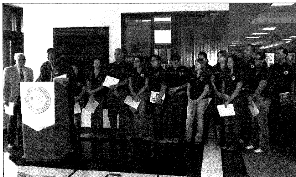
Grupo de la CEIA en la Develación

Un nutrido grupo de estudiantes del Capítulo Estudiantil del Instituto de Agrimensores (CEIA) de la Universidad de Puerto Rico Recinto Universitario de Mayagüez asistió a esta ceremonia, y luego de la misma se dirigieron rumbo al este, a la Isla Municipio de Vieques para conocer más sobre el Conde de Mirasol.