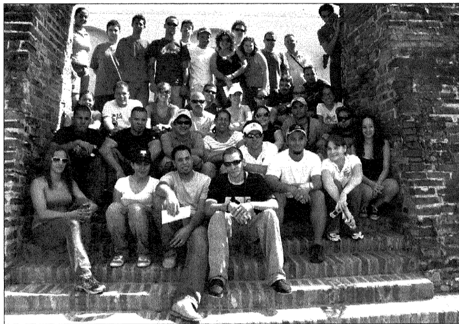
Grupo de la CEIA y acompañantes en el Fortín.